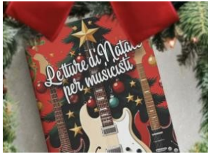
Sei letture per musicisti da regalare a Natale