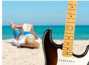
5 (+1) libri da non perdere per un'estate in musica