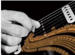
Pletrata alternata all'ennesima potenza: Alternate Picking Improver di Begotti e Fazari diventa Platinum